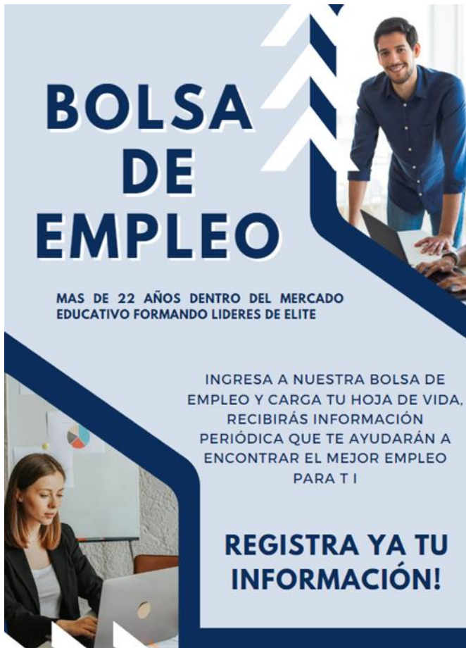
FIGURA X—. Anuncio Expectativa Estudiantes .