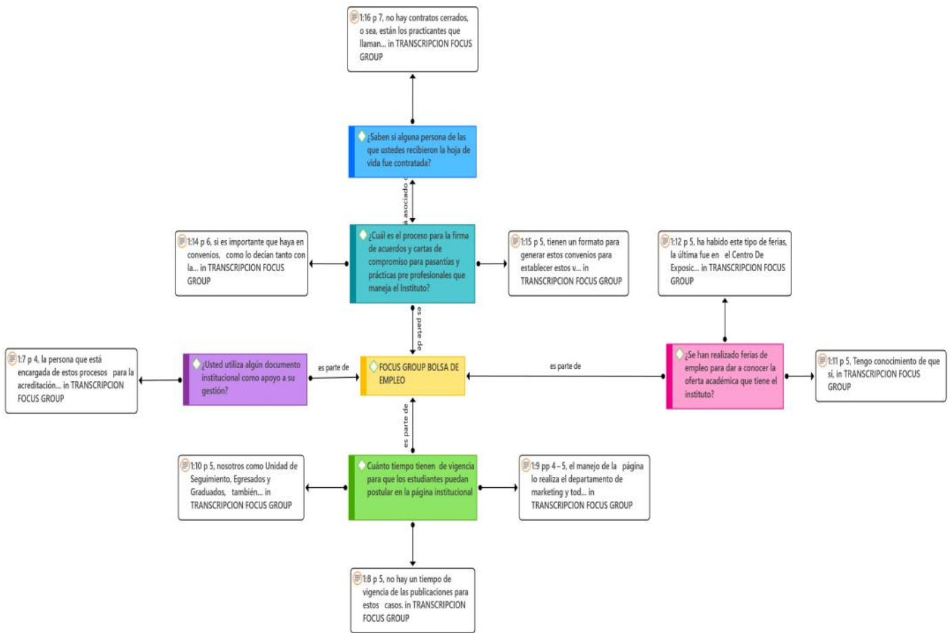
FIGURA III- ATLAS.ti Focus Group

Una vez generado el ATLAS.ti se procedió a crear la matriz FODA en donde al tener una visión en general y específica de las Fortalezas, Oportunidades, Debilidades y Amenazas