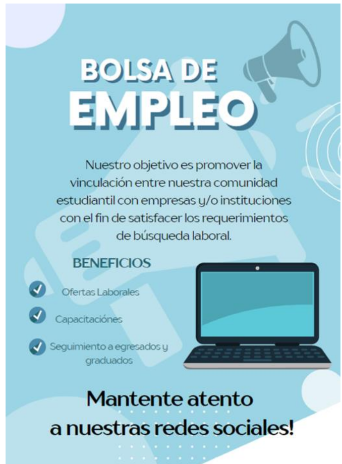
FIGURA IX —. Anuncios Bolsa de Empleo fase de Expectativa.

promocionales junto a una evaluación de estrategias de medios digitales que disponga el Instituto.