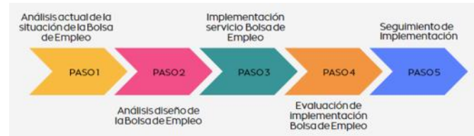
FIGURA IV- Diseño para la Implementación Bolsa de Empleo.

requiere levantar el Instituto de Nivel Superior, la información que se requiere de los estudiantes y la información de las empresas y/o institutos.