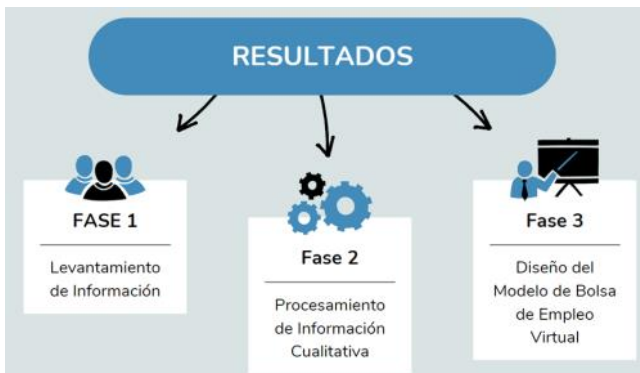
FIGURA I – Esquema de Cuadro Metodológico.

Para el levantamiento de información se lo analizo en tres fases que son las siguientes: