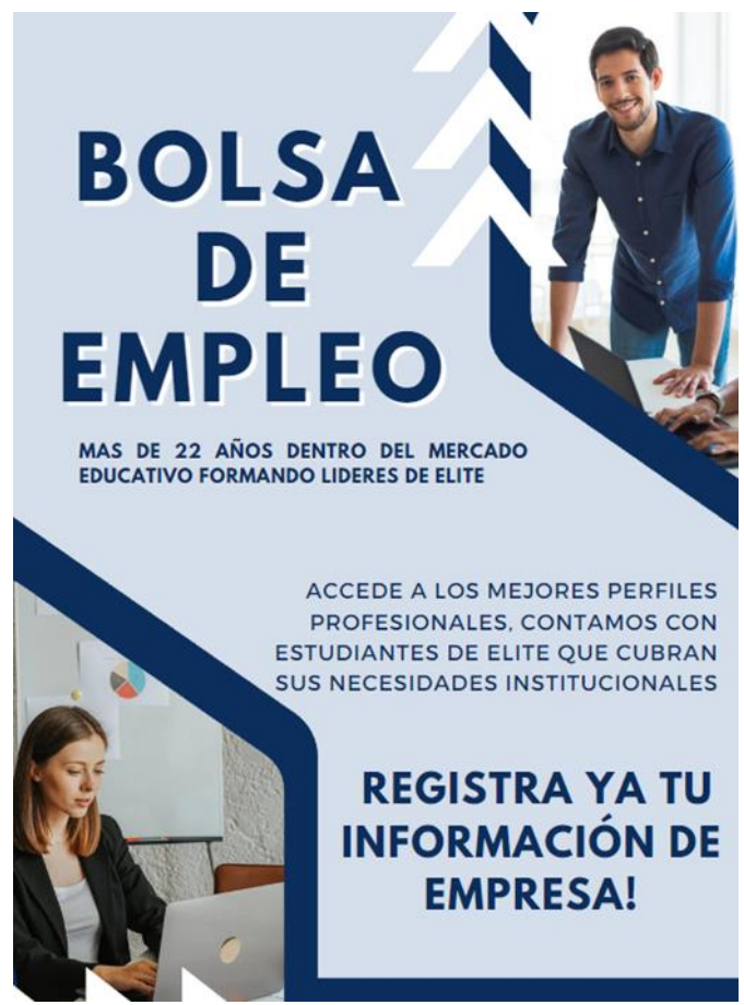
FIGURA XI—. Anuncios Expectativa Empresas y/o Estudiantes.

Saludos, Este nuevo año, SELECCIONAR TALENTOS es fundamental para crear un equipo competitivo y así aportar valor a la Empresa. LA BÚSQUEDA INTELIGENTE DE TALENTOS, aseguran que candidatos son más idóneos para cada vacante. El internet, redes y la tecnología sofisticados no resuelven los mayores problemas de la Selección y Contratación. En el mejor de los casos, pueden ser un complemento útil, solo como fuerte de adquisición de posibles candidatos. Con un proceso bien ejecutado, se obtiene un mapeo completo del mercado objetivo y llegamos a los mejores candidatos. El instituto será un aliado estratégico para sus búsquedas. La garantía, más de 22 años formando profesionales de elite. El inicio de año es la oportunidad perfecta para tomar acciones y dejamos ser parte activa en sus procesos de selección. A sus órdenes por medio del siguiente correo electrónico: seguimiento@abcde.com.ec Atentamente, Unidad de Seguimiento a Egresados, Graduados y Bolsa de Empleo