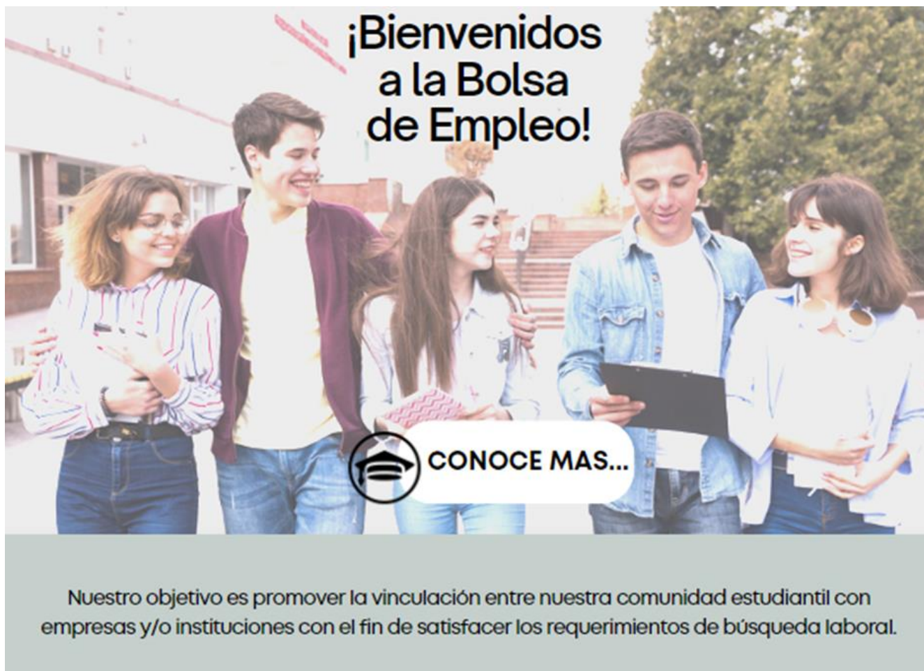
FIGURA V - Diseño página Bolsa de Empleo.

introdutorio que explique los beneficios de este servicio, así como definir qué información van a llenar tanto los estudiantes como las empresas y/o instituciones finalmente se estandarizara formatos de solicitud de ofertas de empleo.