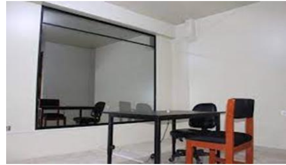
Ilustración 1 - Cámara Gesell

emplean técnicas proyectivas para recopilar información sobre las motivaciones y actitudes de los consumidores, lo que contribuye a una mejor comprensión de sus preferencias y decisiones de compra” (Unila, 2023) “Estas sesiones se realizan con el fin de realizar estudios de imagen y posicionamiento, evaluación publicitaria, desarrollo de nuevos productos o servicios y mystery shopper.” (Boyaca, 2004) “Por último, en el área del Derecho sirve para generar un ambiente ideal Con el objetivo de permitir que la posible víctima de abuso pueda describir los detalles del caso de manera completa y precisa. al que fue perpetrado. La cámara Gesell proporciona un entorno más apropiado para la víctima de un delito, especialmente cuando se trata de un niño o niña que ha sido víctima de un delito de naturaleza sexual. El objetivo es prevenir cualquier forma de revictimización y proteger el bienestar emocional de la persona afectada.” (Boyaca, 2004)