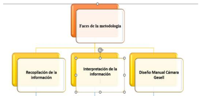
Ilustración 2 - Fases Metodológicas

Se diseñó la parte de metodología en 3 fases que serán detalladas a continuación