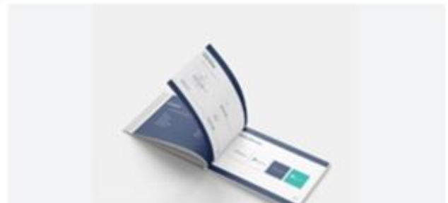
Ilustración 5 - Diseño del manual

Se ingresa la información que va a contener el manual, enfocado en carreras sociales o en comportamiento humano