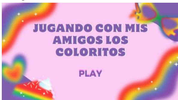
Ilustración 3 Jugando con mis amigos los coloritos

El cuento “Conociendo a mis amigos los coloritos” se creó y diseñó dentro de la plataforma digital Canva basándose en la enseñanza dinámica y básica de los colores primarios designados con una presentación llamativa. Además, permite la interacción con los niños, pues, se procuró plasmar un espacio donde puedan conceptualizar y razonar la ubicación, nombre y referencias de los colores primarios.