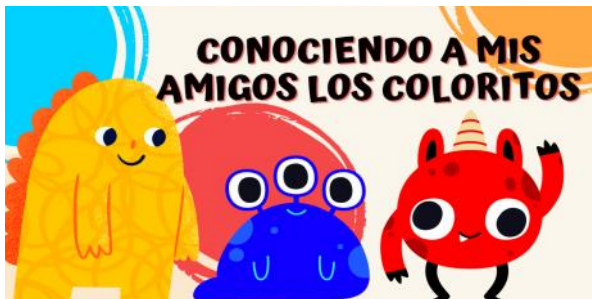
Ilustración 2 Cuento mis amigos los coloritos

Los audios se editaron en el software de Audacity, una herramienta digital de grabación y edición de audios de libre acceso, para que al momento de reproducirlos los infantes que interactúen con el aplicativo puedan disfrutar de un apoyo auditivo que a su vez ayudará a captar de una manera dinámica su atención de forma activa.