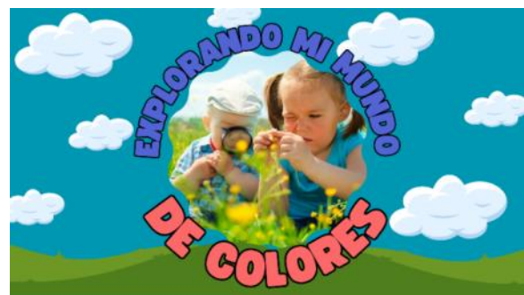
Ilustración 4 Portada del Aplicativo Digital

A través de pruebas con diferentes grupos de niños se realizó las correcciones específicas para responder a las necesidades de los estudiantes, determinando que el lanzamiento del Neobook tenga beneficios para un mejor aprendizaje con la utilización de herramientas atractivas enfocadas en el ámbito educativo.