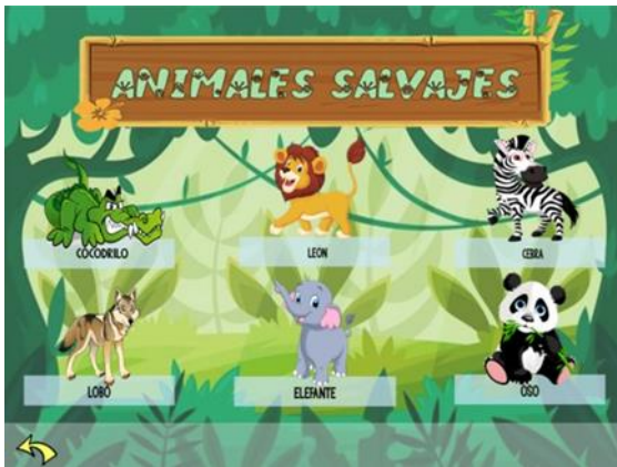
Ilustración 6 pantalla animales salvajes