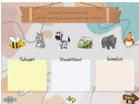
Ilustración 7 pantalla de Juegos