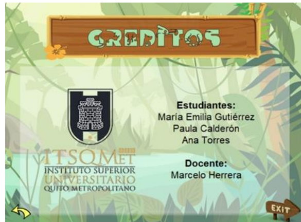
Ilustración 8 pantalla de créditos