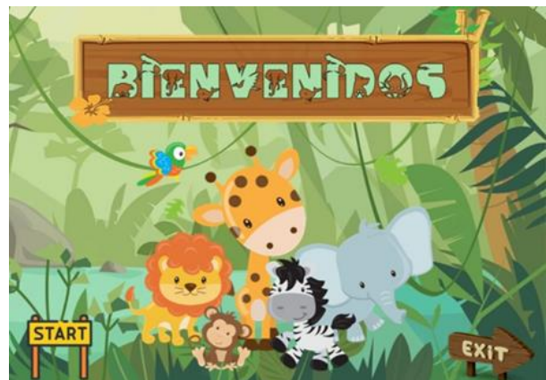
Ilustración 4 pantalla de bienvenida